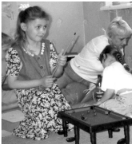
Діти та вихователі під час занять в центрі «Родина»

Черкаське і Київське відділення Всеукраїнської мережі людей, які живуть з ВІЛ/СНІД (ЛЖВС), благодійний фонд «Перемога», Броварський район Київської області і благодійна організація «З надією» , Кривий Ріг Дніпропетровської області, працюють з дітьми і сім'ями, яких торкнулася проблема ВІЛ/СНІДу і надають широкий спектр соціальних, навчальних, психологічних та інших послуг. Докладніше читайте про роботу «Перемоги» і «З надією» у розділі «Досягнення та історії успіху» на стор. 7.