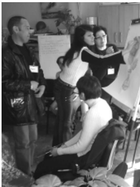
Заняття для сімей в центрі «Родина»

У січні 2006 р. БО «З надією» отримала шестимісячний грант від програми «Родина для дитини», метою якого було розширення спектру послуг та створення центру комплексної підтримки людей, яких торкнулась проблема ВІЛ/СНІДу. Створений центр отримав назву «Родина». Центр надає послуги дітям та сім'ям, яких торкнулась проблема ВІЛ/СНІДу, а також ВІЛ-позитивним вагітним жінкам. За допомогою фінансування,