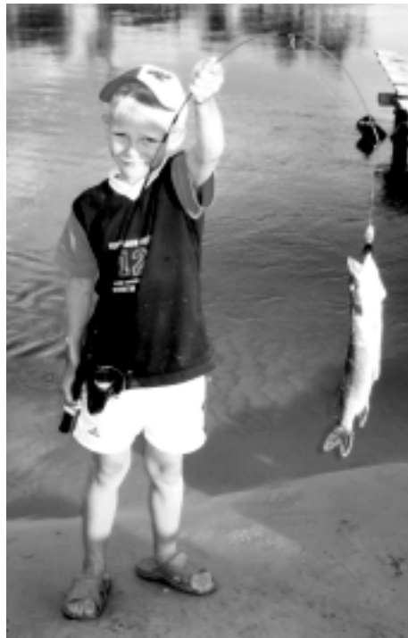
Риболовля в літньому таборі

Влітку 2005 і 2006 років програма «Родина для дитини» надала фонду «Сонячне світло» два партнерські гранти для підтримки щорічного літнього табору для дітей з сімей груп ризику Броварського району та для дітей з реабілітаційного центру. Цілі програми літнього табору такі: (I) Надання реабілітаційних послуг дітям з неблагополучних сімей; визначення основних проблем, з якими стикаються такі діти і розробка стратегій раннього втручання для підтримки сімей; (II) Надання реабілітаційних послуг